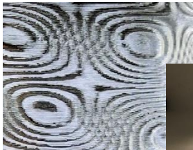
数学的曲線のデザインと 0.5mm 以下の精度により実現したモアレ縞模様

素材は、光沢・透明感を出せる成分解性プラスチック (PLA) を使用。製品の厚さを 1 mm 以下まで薄くでき、素材の光沢・透明感を活かした製品づくりが可能です。中が空洞なのに、上も下も閉じた球形を印刷できる 3D プリンタは他にないと自負しております。