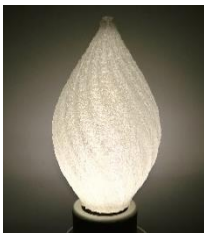
和紙のような風合い

通常の 10 倍以上の印刷スピードを実現。月産 100 個程度の生産にも対応可能です