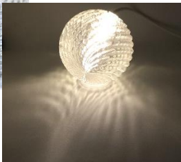
印刷したシェードが作りだす陰も楽しみいただけます