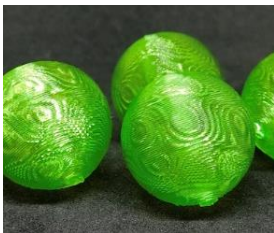
素材を変えれば色付き加工も可能